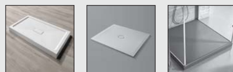
CATINO ONDA JOIN