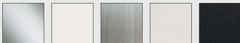
EXTRABRILL BIANCO EFFETTO INOX SPAZZOLATO BIANCO MATERICO NERO MATERICO